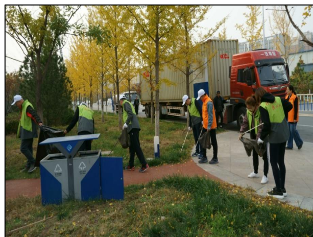
区石龙服务中心开展环境整治活动