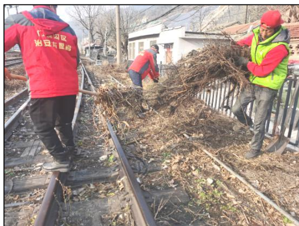
大台街道整治铁路周边环境