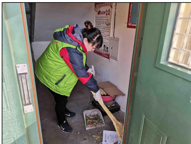
东辛房街道清理堆物堆料

为235起，罚款52340元。区交通局：近日，在门城地区、国道108沿线及石门营地区开展违法大货车夜查执法行动。龙泉镇：近日，对桃园社区东门北侧违规停车进行联合执法检查。